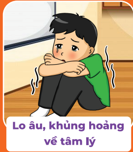
Lo âu, khủng hoảng về tâm lý