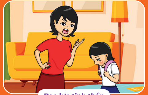
Bạo lực tinh thần