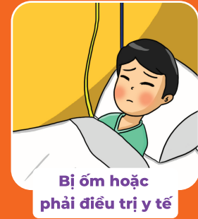
Bị ốm hoặc phải điều trị y tế