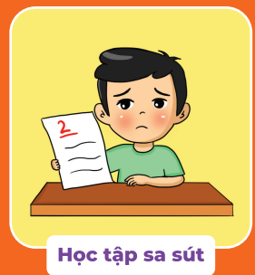
Học tập sa sút