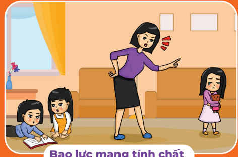
Bạo lực mang tính chất cô lập trẻ