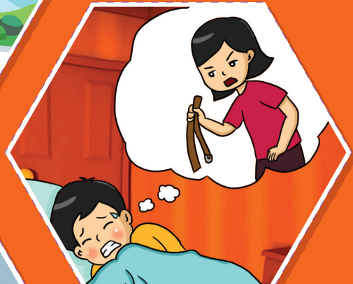
Khó ngủ, sợ hãi trong lúc ngủ