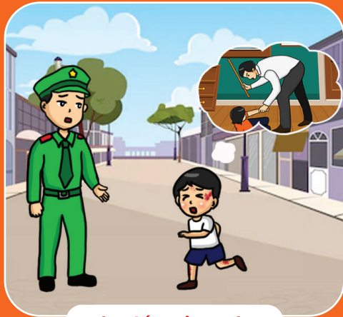
Tìm đến nơi an toàn