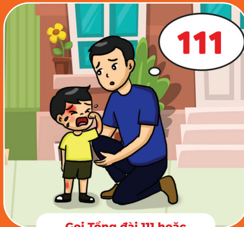
Gọi Tổng đài 111 hoặc báo cho người em tin tưởng