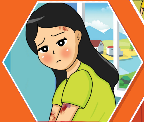
Thương tích trên thân thể