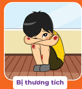
Bị thương tích