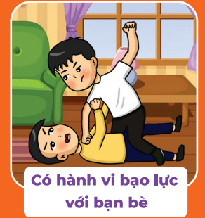
Có hành vi bạo lực với bạn bè