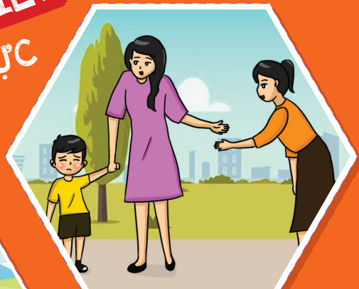
Bỗng dưng nhút nhát, sợ sệt