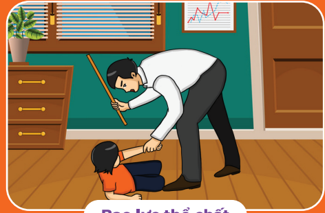
Bạo lực thể chất