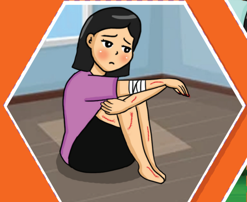
Tự hủy hoại bản thân và xa lánh bạn bè